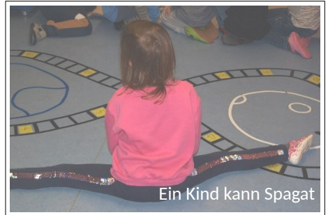
Ein Kind kann Spagat

Zudem nehmen viele von ihnen zur Zeit aktiv an einem Sportprojekt in der Kita teil.