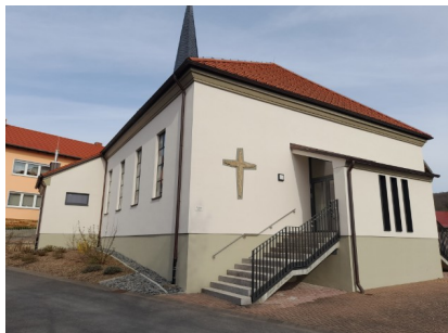
Kirche in Theinfeld