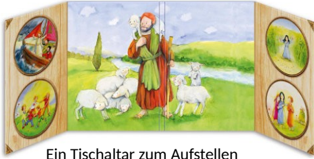
Ein Tischaltar zum Aufstellen von Petra Lefin

Diesen kleinen Altar zum Aufstellen bietet der Don Bosco-Verlag an. Er ist aus stabiler Pappe und ihr könnt ihn an einem schönen Platz oder auf einem Tuch aufgeklappt hinstellen.