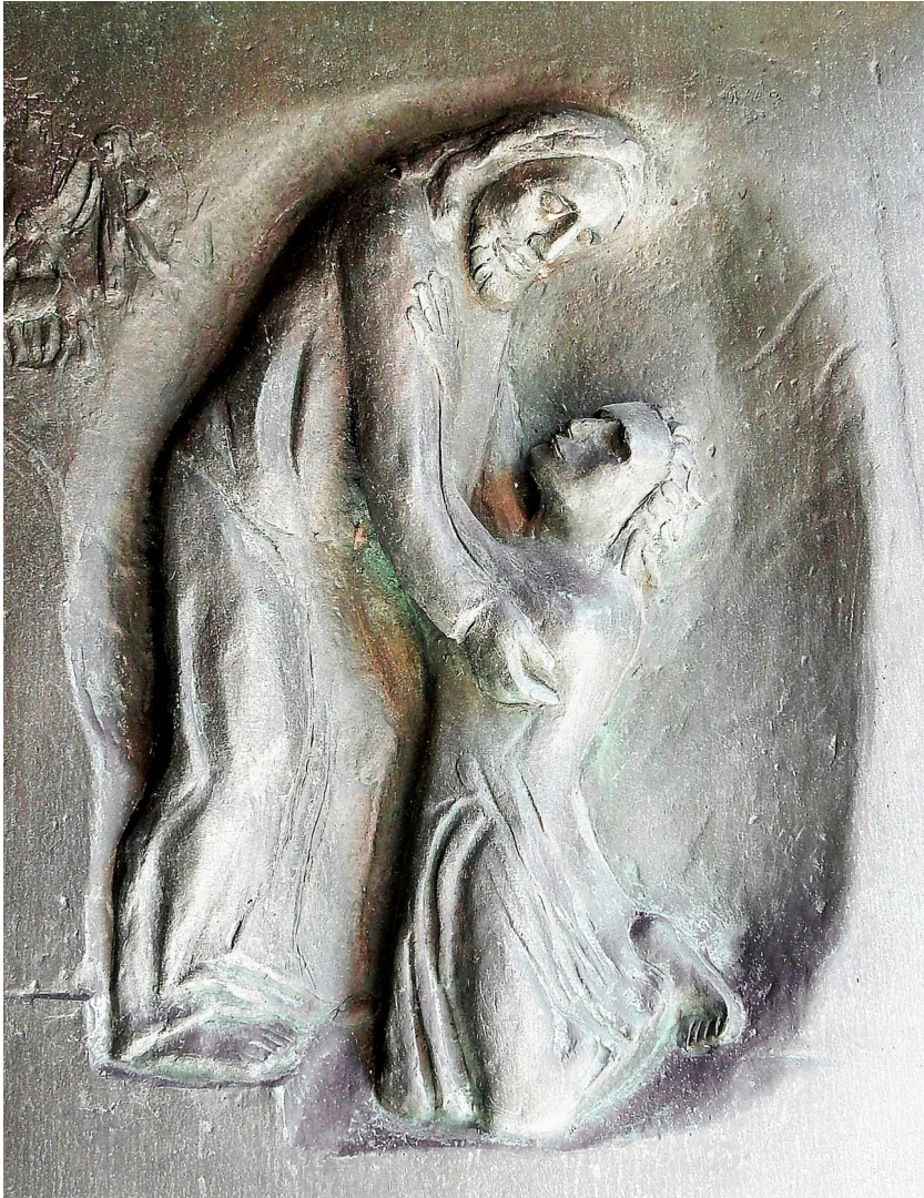
Bild: Friedbert Simon (Fotografie) / Roland Friederichsen (Künstler), aus www. Piarrbriefservice.de

PG Im Lauertal PG St. Johannes-Maria-Vianney Münnerstadt mit Filialen